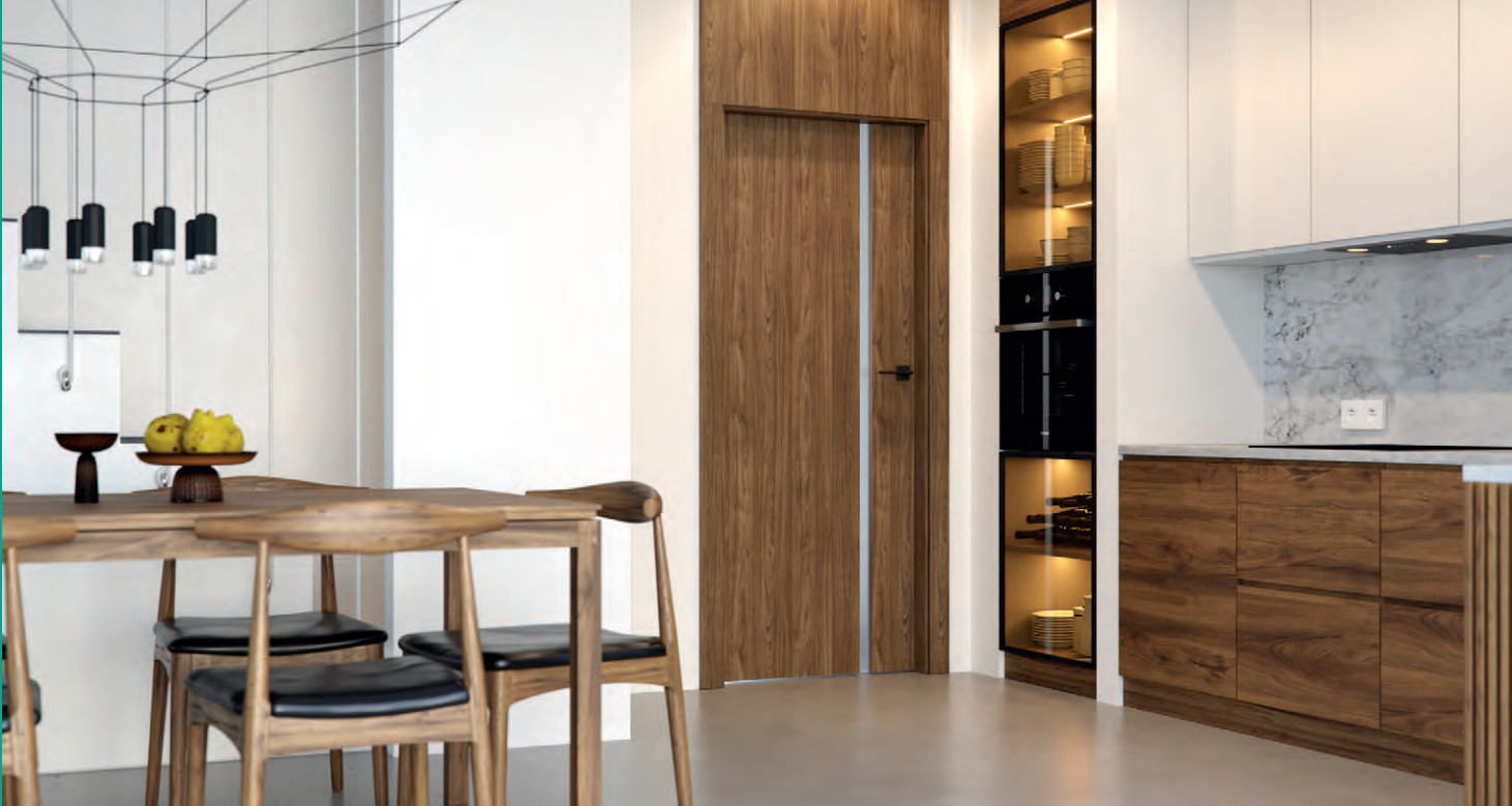
PORTA FOCUS 4.A, Orech Naturálny (matný), kľučka LAGO čierna, zárubňa LEVEL (zakázková výroba PORTA KONTRAKT)