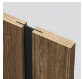
spojenie so sklom „na hranu“ krídlo bezpolodrážkové