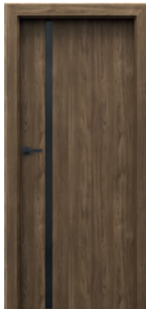
model 4.A s čiernym sklom